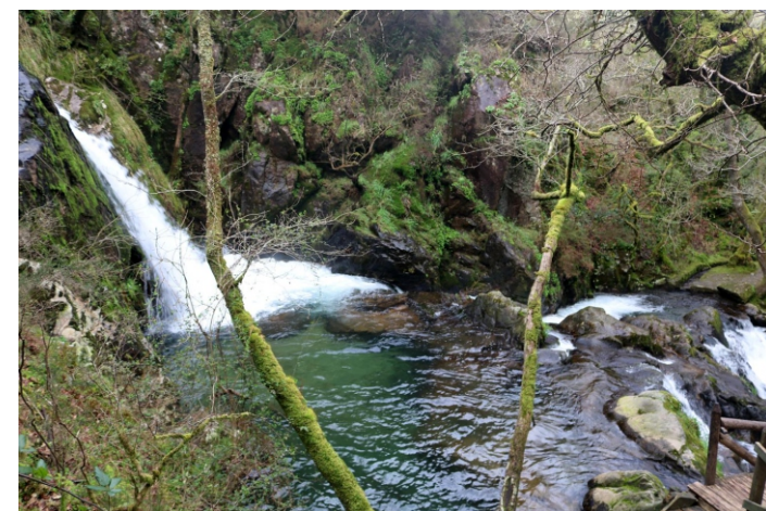
Ferzenza e poza