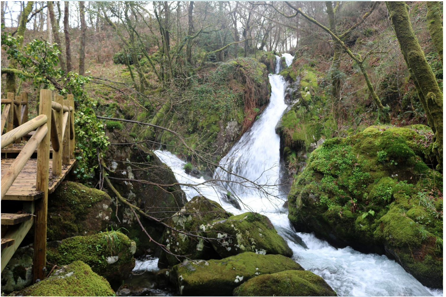
Fervenzas na confluencia do rego do Ferreño co río Valga