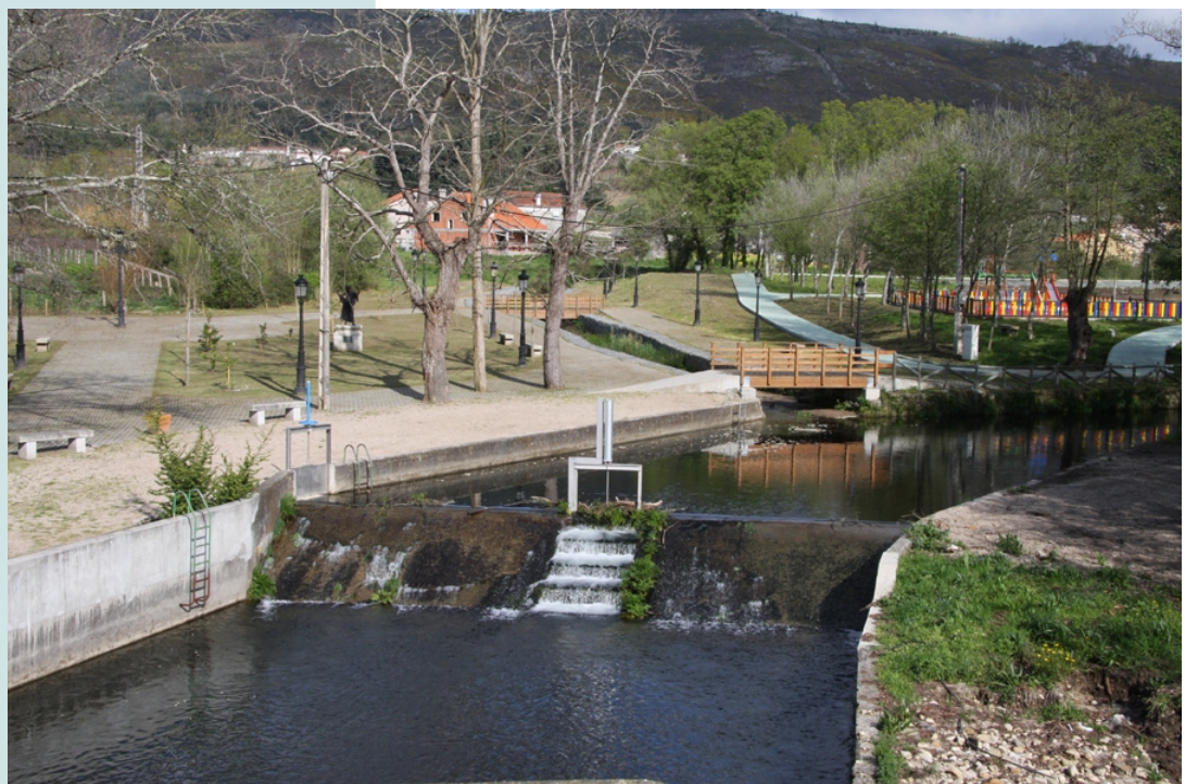
Río Valga na área de lecer de Valga, no inicio da ruta