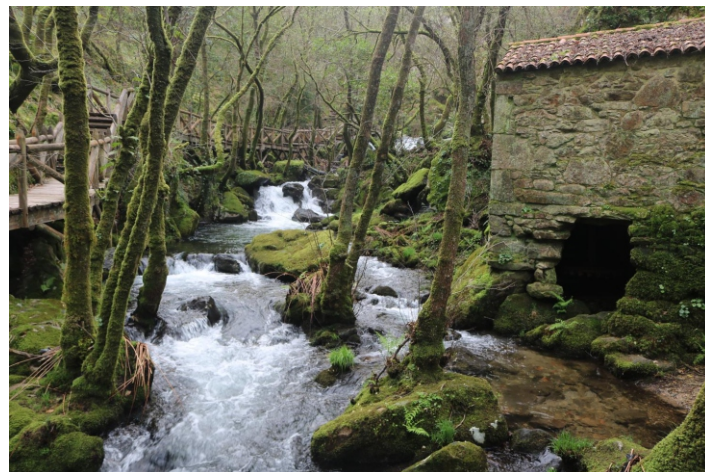
Muíño de Parafita, no comezo da ruta